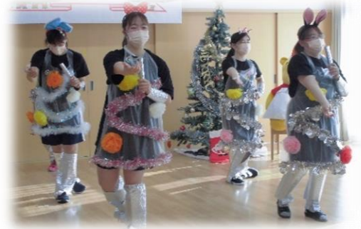
第二みやま荘のピンクレディーです