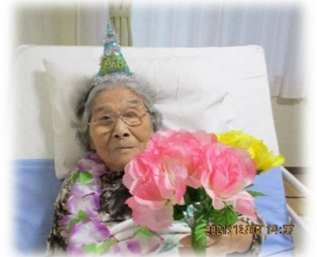
『おめでとうございます』