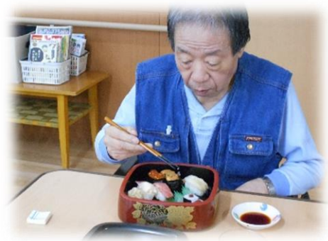
「お味はいかがですか！！」