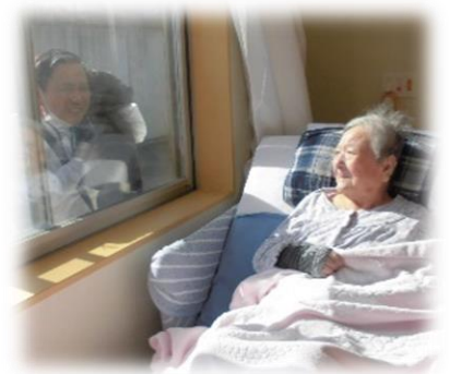
建物の外を回って、 居室の窓越し面会 (現在もOK)