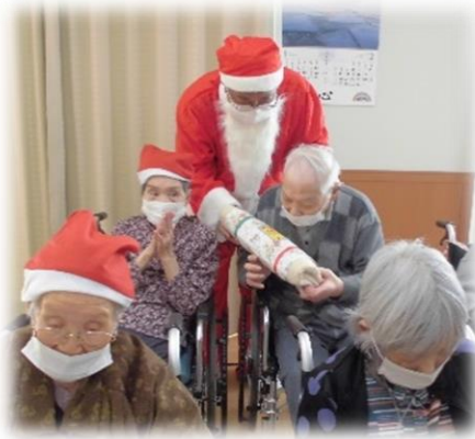
【メリークリスマス】