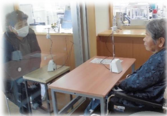
玄関でのガラス越し面会 (現在もOK)