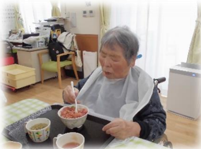
大きなお口ですこと。