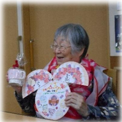
誕生日に各ユニットでお祝いしました。