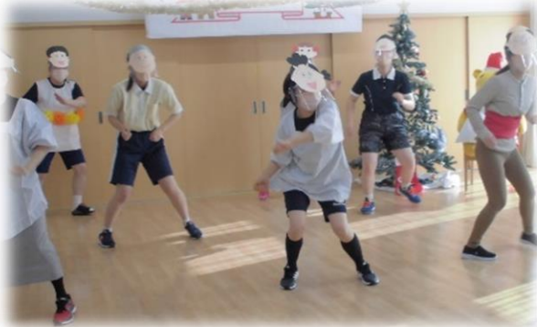
サザエさん一家 登場